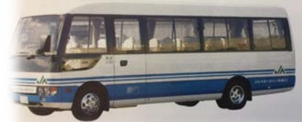
マイクロバス 斎場往復1台