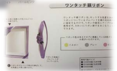
写真額装飾 ワンタッチリボン ピンク・グレー・イエロー