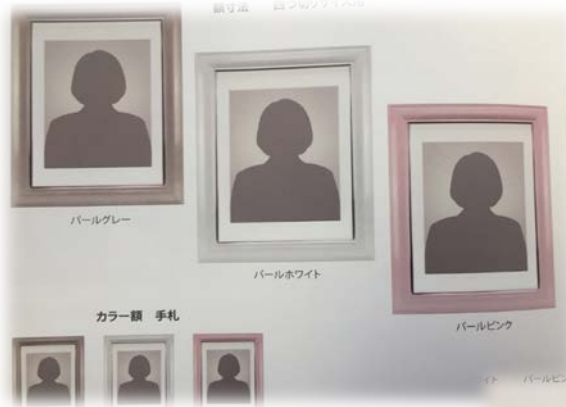
写真 カラー額セット 四つ切・手札 ・グレー ・ホワイト ・ピンク