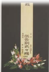
大看板 木製10尺看板 花飾り付