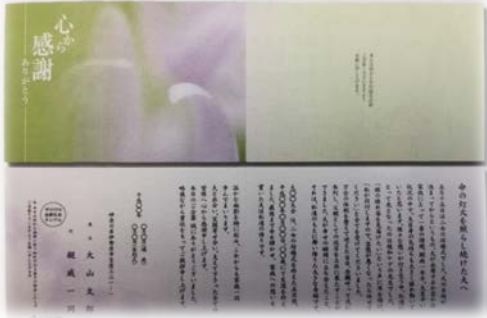
礼状 オリジナル 300枚