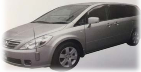
搬送車 自宅他～ホール