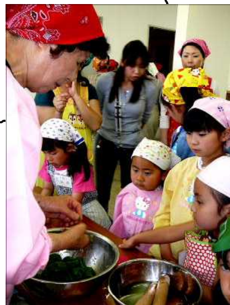
平成22年5月8日 よもぎ団子教室

〒227-0064 横浜市青葉区田奈町52-8 J A 田奈 指導相談部「よもぎ団子教室係」 TEL 045-981-6281 FAX 045-989-4300